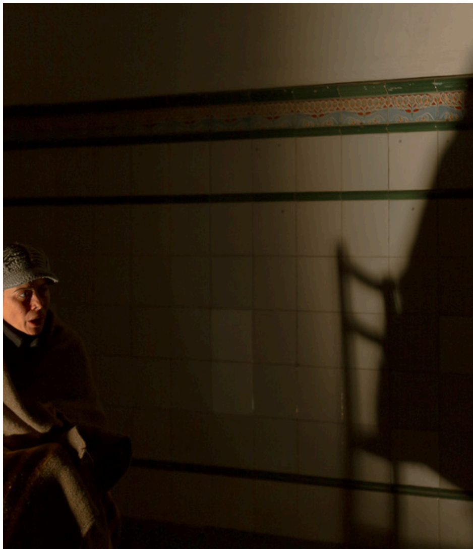
La tormenta de nieve de Lev Tolstói