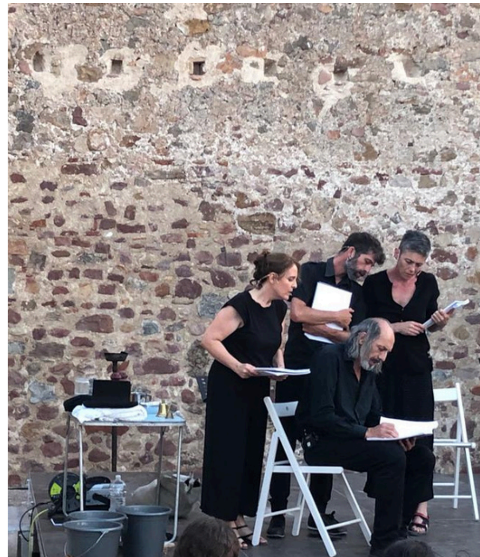
El gran fuego de Roland Schimmelpfennig